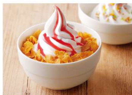
Fruits & Dessert Bar