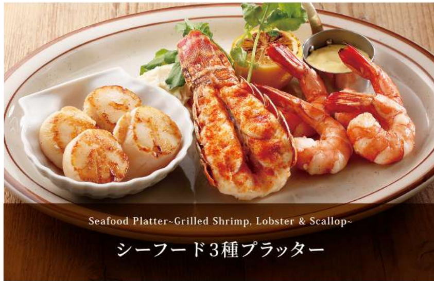
Seafood Platter-Grilled Shrimp, Lobster & Scallop- シーフード3種プラッター