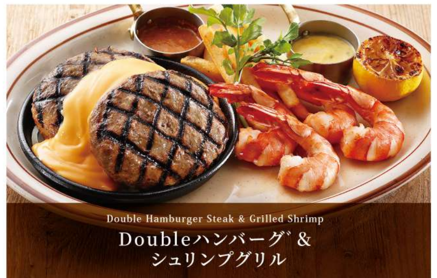
Double Hamburger Steak & Grilled Shrimp Doubleハンバーグ & シュリンプグリル