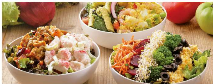
Fresh Salad & Deli Salad Bar