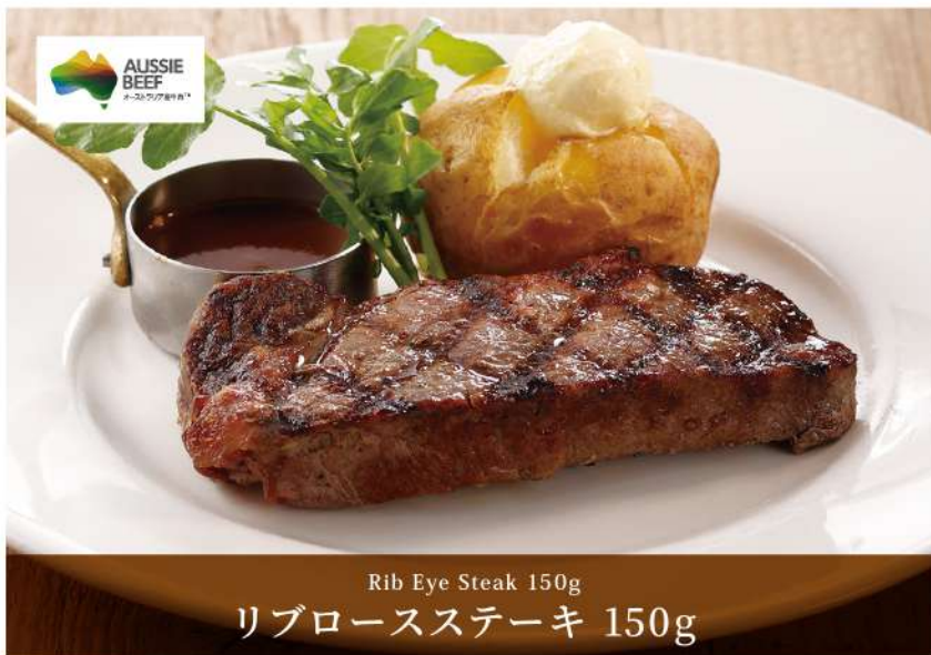
Rib Eye Steak 150g リブローズステーキ 150g