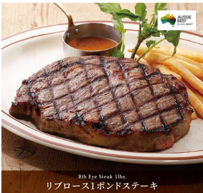
Rib Eye Steak 1lbs. リブローズ1ポンドステーキ

1ポンド(450g)の厚切りステーキ。1インチの厚みがあるからこそ味わえる ビーフ本来の美味しさをお楽しみください。