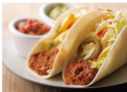
Hot Food Bar