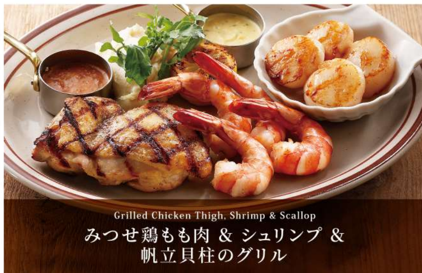
Grilled Chicken Thigh, Shrimp & Scallop みつせ鶏もも肉 & シュリンプ & 帆立貝柱のグリル

とろけるチーズソースがけハンバーグ2枚と BBQ ポークスペアリブ4本の ボリューム感あるコンボ。