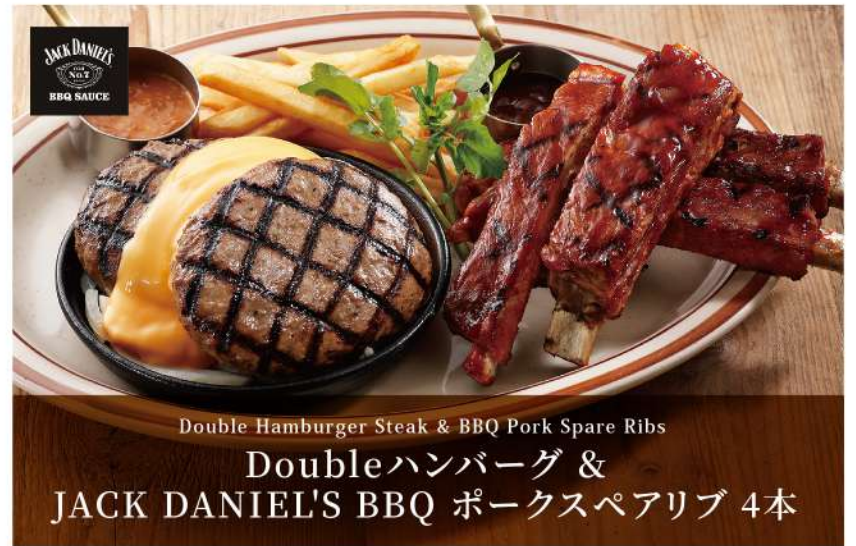
Double Hamburger Steak & BBQ Pork Spare Ribs Doubleハンバーグ & JACK DANIEL'S BBQ ポークスペアリブ 4本

ロブスター1尾、帆立貝柱4個、 シュリンプ4尾。 海の幸を存分に楽しめるコンボ。