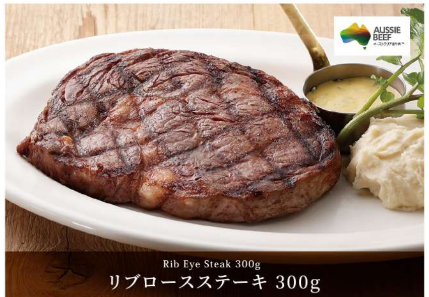
Rib Eye Steak 300g リブローズステーキ 300g