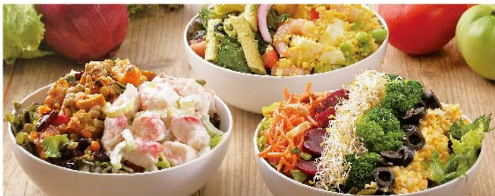
Fresh Salad & Deli Salad Bar

シニアサラダバー (65才以上) Customers over 65 years old ¥2,163 (税込 ¥2,379)