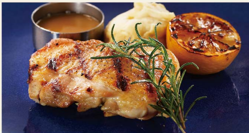
Grilled Chicken Thigh みつせ鶏もも肉のグリル