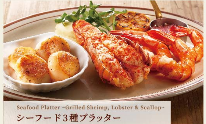
Seafood Platter ~Grilled Shrimp, Lobster & Scallop~ シーフード3種プラッター