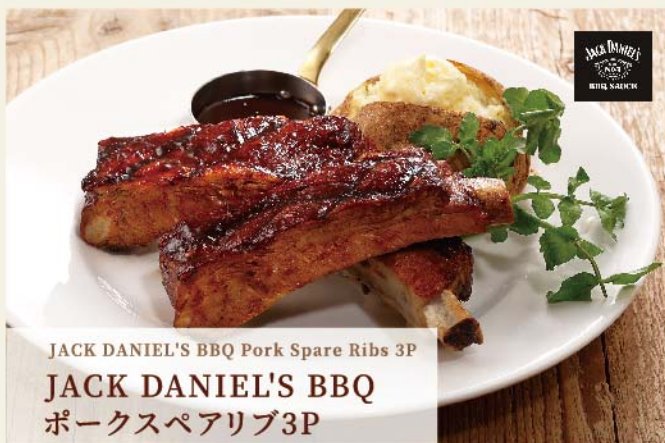
JACK DANIEL'S BBQ Pork Spare Ribs 3P JACK DANIEL'S BBQ ポークスペアリブ3P