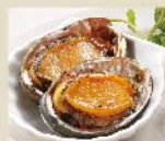
Add on Grilled Ezo Abalone (2P) + エゾアワビ