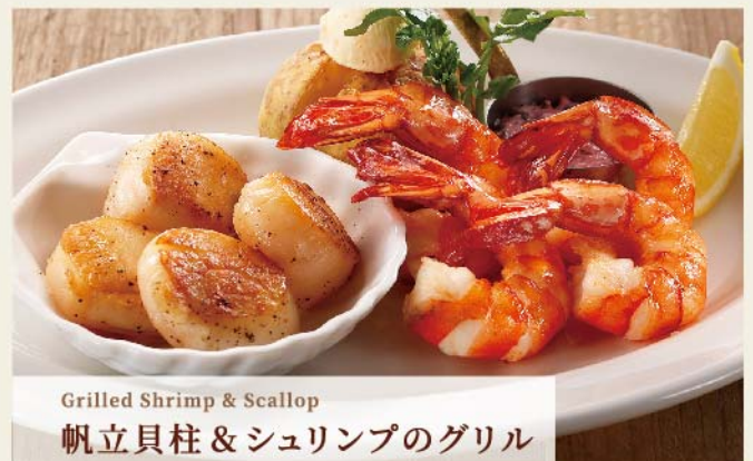
Grilled Shrimp & Scallop 帆立貝柱 & シュリンプのグリル