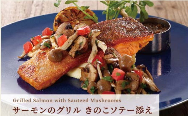
Grilled Salmon with Sauteed Mushrooms サーモンのグリル きのことソテー添え