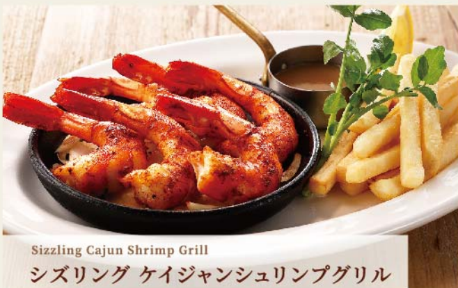
Sizzling Cajun Shrimp Grill シズリング ケイジャンシュリンプグリル

ロブスター 1 尾、帆立貝柱 4 個、シュリンプ 4 尾。 海の幸を存分に楽しめるコンボ。