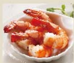
Add on Grilled Shrimp (4P) + シュリンプ グリル