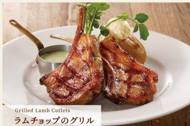
Grilled Lamb Cutlets ラムチョップのグリル

パイナップルジュース等で柔らかく下茹でし、 ジャックダニエル BBQ ソースで香ばしくグリルした シズラー自慢のスペアリブ。