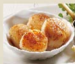
Add on Grilled Scallop (4P) + 帆立貝柱の グリル