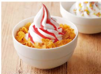
Fruits & Dessert Bar