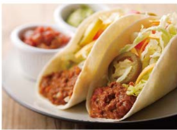
Hot Food Bar