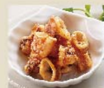
Add on Fried Calamari + カラマリ フライ