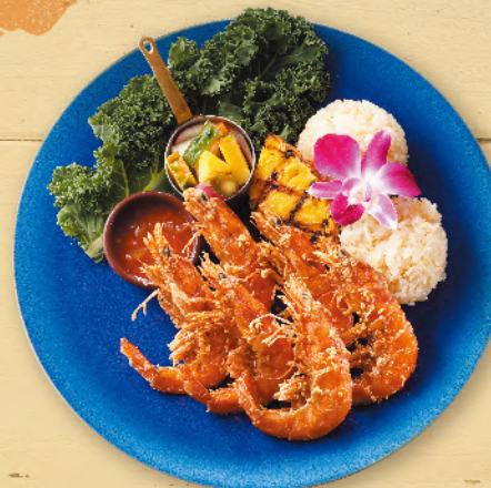
Hawaiian Garlic Shrimp Plate ガーリックシュリンププレート