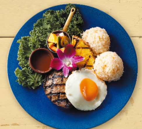
Loco Moco Plate ロコモコプレート