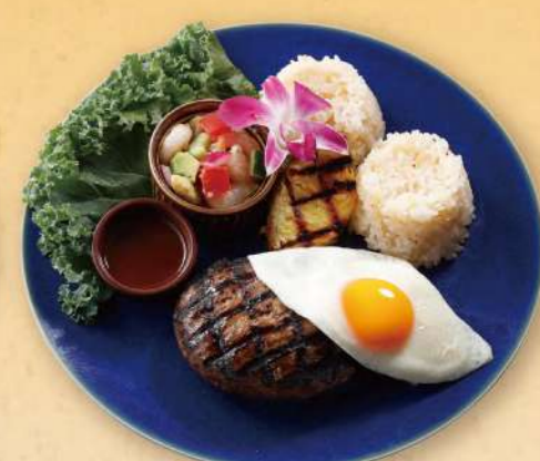
Lunch Loco Moco Plate ロコモコプレート