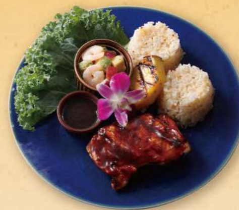
Lunch Huli Huli Chicken Plate フリフリチキンプレート