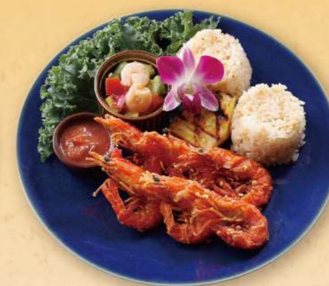
Lunch Garlic Shrimp Plate ガーリックシュリンププレート